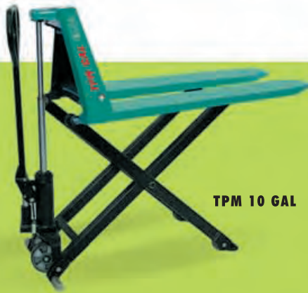
TPM 10 GAL