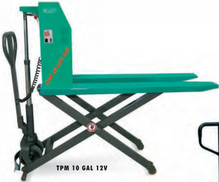
TPM 10 GAL 12V

Pesaje electrónico. Bomba manual para la elevación de simple efecto. Tracción manual.